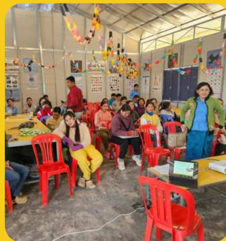
Lezioni per adulti