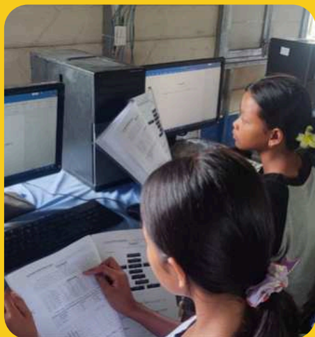
Lezioni di uso del computer

Il Centro è completato da un dormitorio e da una mensa per permettere a studenti e insegnanti che abitano lontano, di pernottare nella struttura.